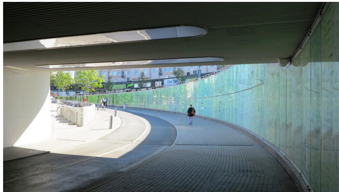
Ūmeo pilsētas tunelis LEV

Vietējā līmenī tas ir īpaši efektīvs, jo tuvāk iedzīvotāju vajadzībām